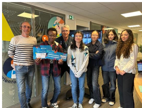
Le groupe « façon puzzle » lors de la présentation au jury et avec sa récompense.